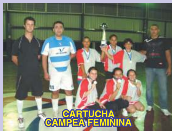
CARTUCHA CAMPEA FEMININA