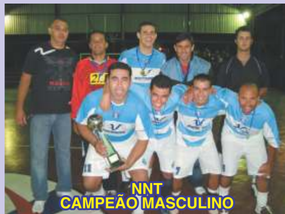
NNT CAMPEÃO MASCULINO