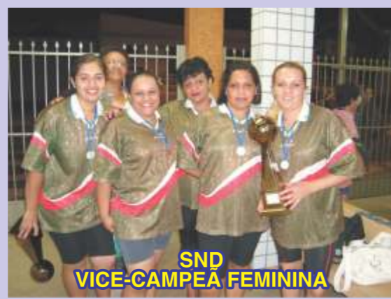
SND VICE-CAMPEA FEMININA