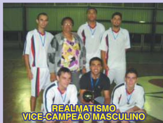
REALMATISMO VICE-CAMPEÃO MASCULINO