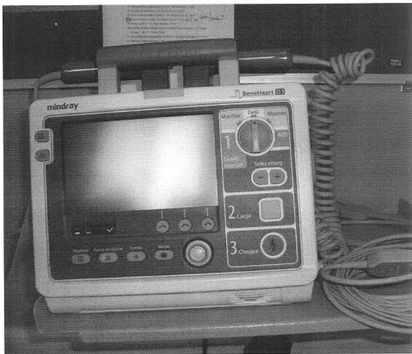
Desfibrilador /Cardioversor ( do Carro de Emergência) : CV: 747796/2010

Handwritten signature and initials: ayp f