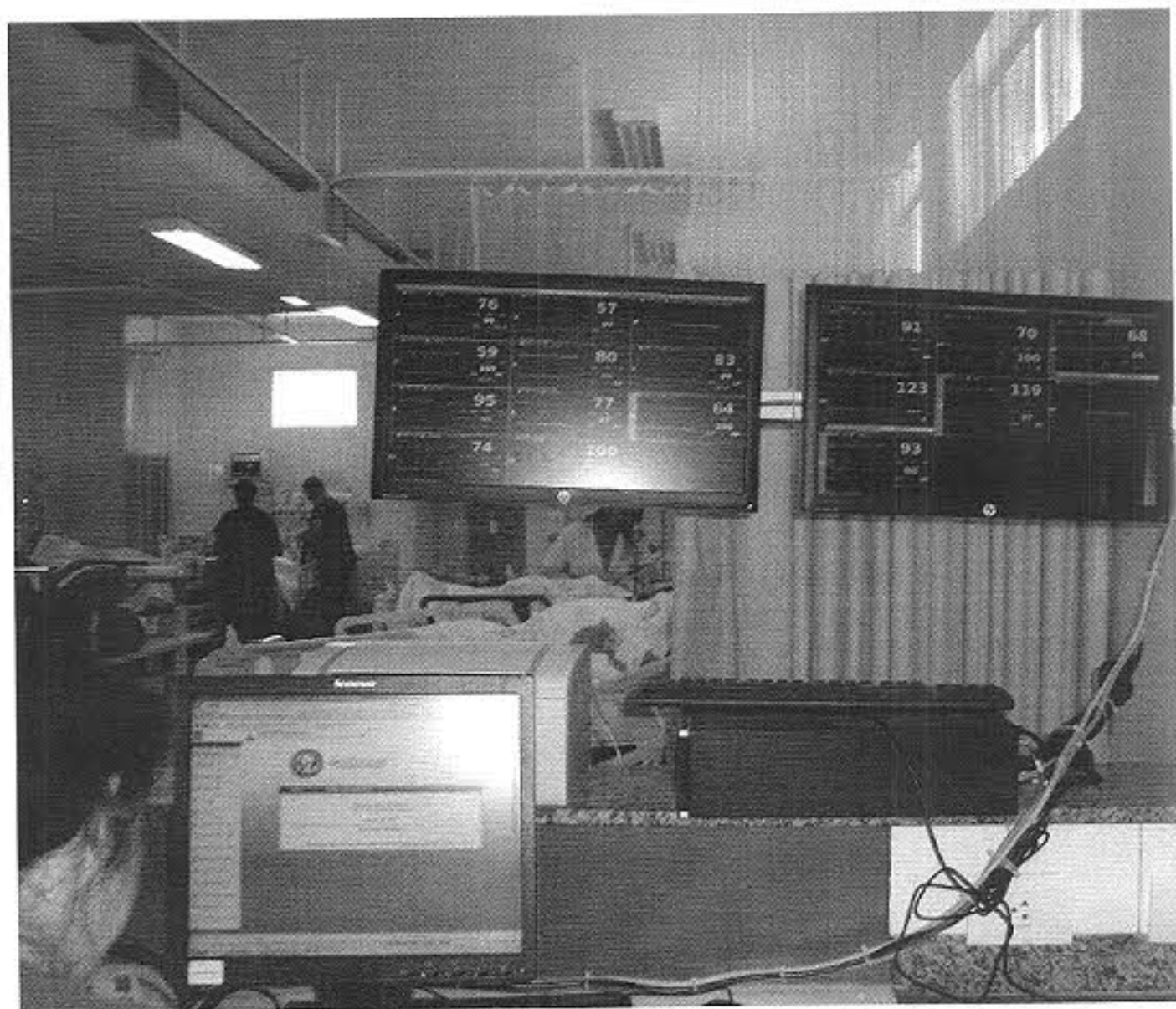
Central de Monitoração para UTI- CV: 747796/2010