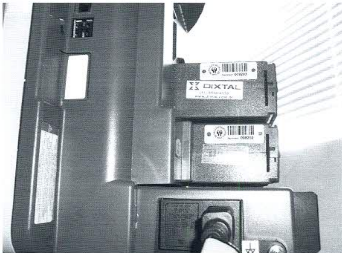
PLAQUETA DE IDENTIFICAÇÃO – CV Nº 748696/2010

Assinatura manuscrita em azul, localizada no canto inferior direito da página.