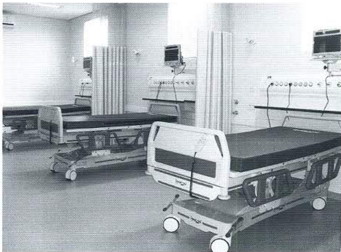
UNIDADE DE DOR TORÁCICA – CV Nº 748696/2010

Assinatura manuscrita em azul, localizada no canto inferior direito da página.