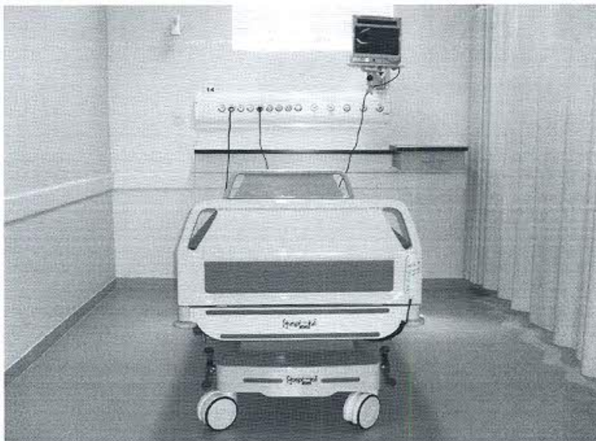
CAMA MOTORIZADA – CV Nº 748696/2010