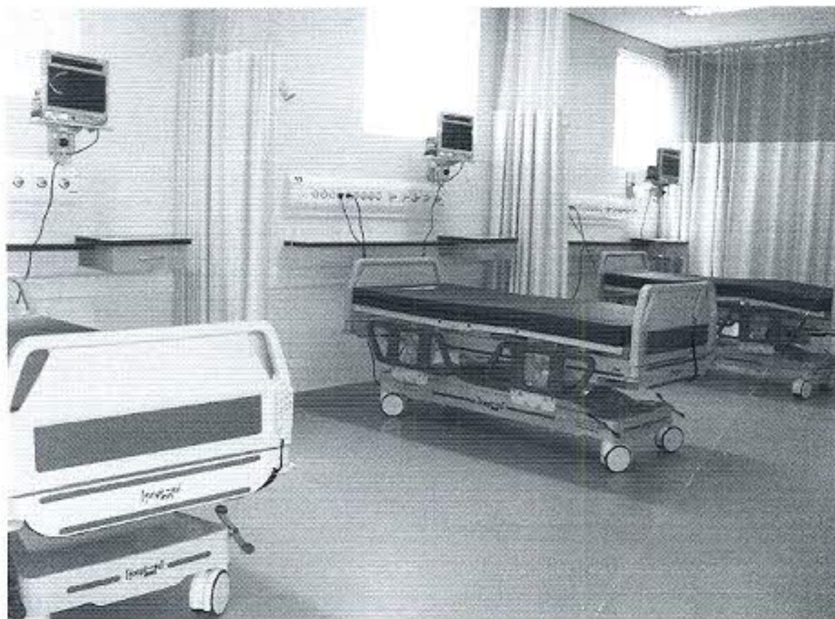
UNIDADE DE DOR TORÁCICA – Nº 748696/2010

A handwritten signature in blue ink, appearing to be 'D. F.', located in the bottom right corner of the page.